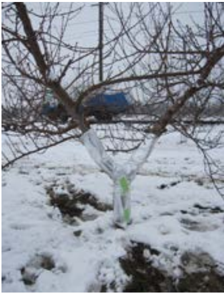
写真1 アルミ蒸着気泡緩衝材の主幹部被覆 によるモモ凍害対策 主幹部にそのまま巻き付け養生テープなどで留 めれば、簡単に被覆できる

く農業運営委員会では、既存の樹園地を基盤整備、集約化し、新たに10a当たり7～8本の疎植でかつ低樹高の園地を造成、省力と収益性をアップするとともに遊休農地の解消、担い手育成も実現している。次世代につながる営農モデルとして山梨県で注目の取組みを、山梨県果樹試験場の曾根英一氏に紹介いただいた。