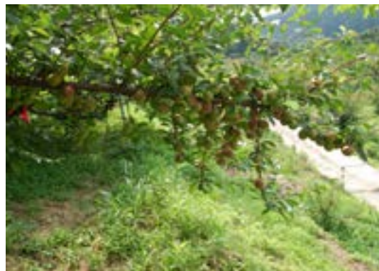
写真2 露茜は枝先の切返しにより着果性が向上し、玉揃いも良好となる 左：枝先を切り返していない枝、右：枝先を切り返した枝