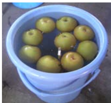
写真3 比重1.031の塩水を用いた簡易なナシ果実生理障害予測法

また生産者事例でも同じ九州・福岡県の、JAみなみ筑後柑橘部会の実践を紹介。10月中下旬の単価（2017年実績352円/kg）としては日本のトップクラスを誇る品種'北原早生'をはじめと