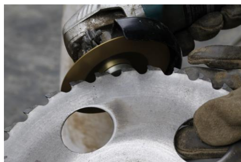
簡単目立てで切れ味バツグンに