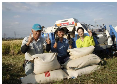
ワラ切り刃と深こぎ改善で1袋増収