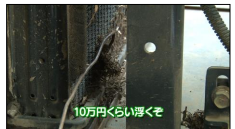
ラジエータの詰まり掃除で10万円浮く