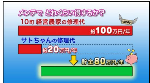
機械を壊さなければ更新費用もどんどん貯まる