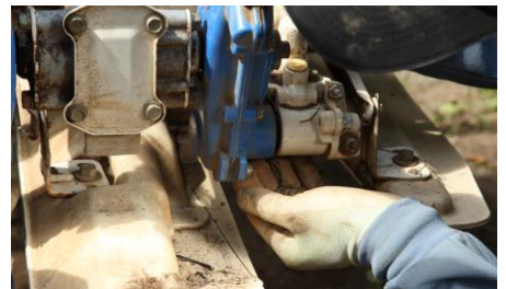
植え付け部の絡まり掃除で5万円浮く